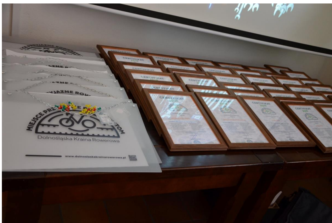
Certyfikaty MPR w Dolnośląskiej Krainie Rowerowej

Nabór powinien być prowadzony przy pomocy strony internetowej systemu / lidera, z odpowiednim wypromowaniem inicjatywy, w celu dotarcia do możliwie pełnej grupy zainteresowanych podmiotów. Zmniejsza to znacznie selektywność takiego wsparcia, co ma istotne znaczenie np. przy ustalaniu zakresu pomocy publicznej.