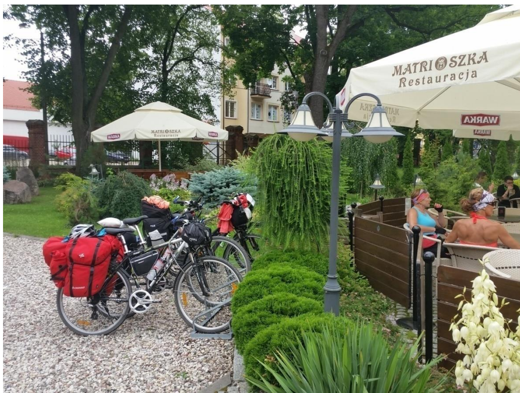
Fot. 2. Turyści rowerowi w restauracji na szlaku Green Velo

Pozwala również uzyskać informacje zwrotne o jakości oferowanych usług, co umożliwia ich poprawę. Jednocześnie status MPR inspirowanie do rozwoju oferty danego przedsiębiorcy, przyczyniając się do wzrostu jej jakości i dywersyfikacji zakresu usług, co również zwiększa jego konkurencyjność.