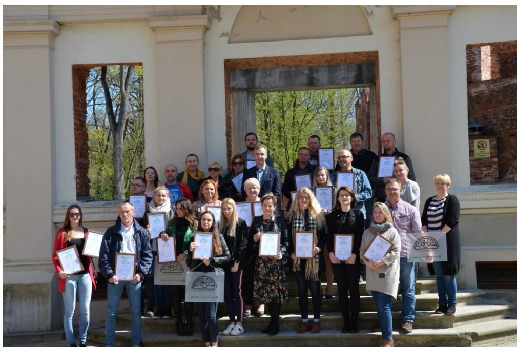
Rozdanie certyfikatów obiektom MPR w Dolnośląskiej Krainie Rowerowej

System cieszy się dużym zainteresowaniem partnerów oraz rowerzystów i stanowi istotny element produktu turystycznego, dedykowanego rowerzystom w Dolnośląskiej Krainie Rowerowej. Informacje o systemie znaleźć można na stronie internetowej Dolnośląskiej Krainy Rowerowej: http://dolnoslaskakrainarowerowa.pl