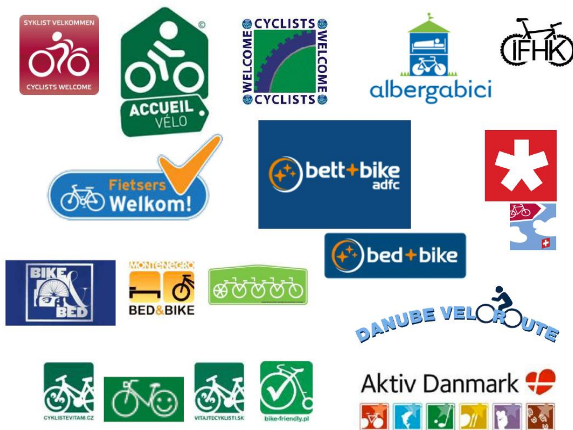
Rys. 1. Przykładowe logotypy systemów rekomendacji MPR w Europie, opracowanie własne

Współpraca w ramach systemu daje partnerom biznesowym korzyści w postaci zwiększenia ruchu turystycznego, a więc przychodów. Obiekty takie mogą stosować specjalne oznakowanie, wyróżniające ofertę od konkurencji. Są też w sposób szczególny promowane na mapach, w przewodnikach oraz w internetowych narzędziach komunikacji marketingowej, dedykowanych rowerzystom.